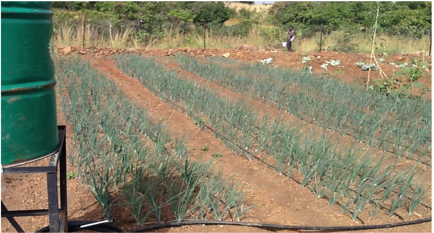
Kit de micro irrigation de 100 m 2 de type goutteur intégré NETAFIM à Sansana (PONI)