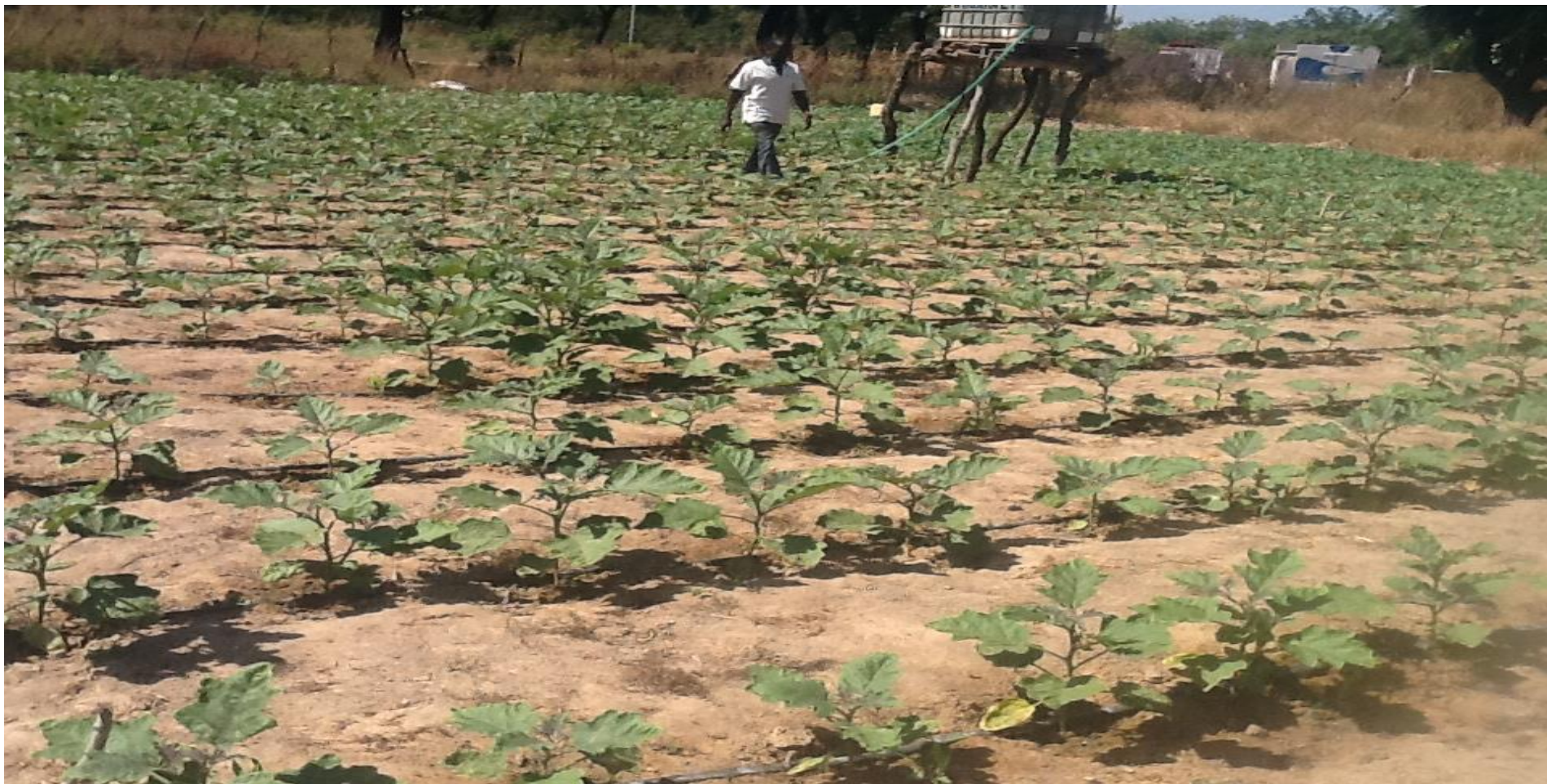
Kit de micro irrigation de démonstration de 500 m 2 , système micro tubes iDE à Léo